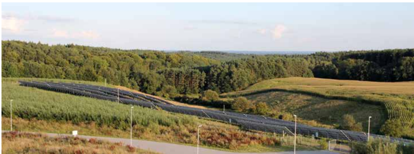
GKE, jako jeden z nielicznych w kraju produkuje już energię, m.in. dzięki naszej spółce Eneri i jej farmie fotowoltaicznej.