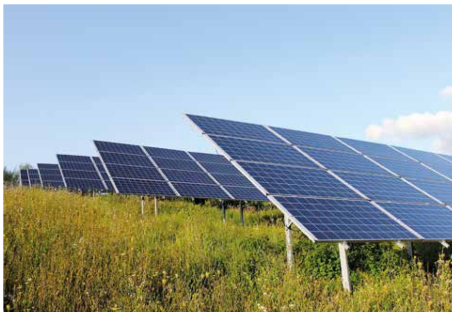
Farma fotowoltaiczna Eneri

Klaster ma pomóc naszym spółkom w osiągnięciu lepszej pozycji rynkowej oraz stworzyć możliwości, jakie niesie nowe prawo o rozproszonych źródłach