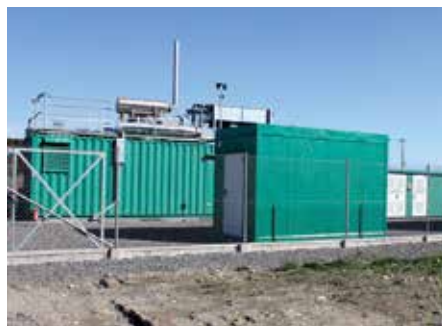
Neo Energy Chróścik