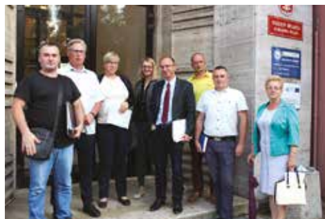
... i podczas wspólnej wizyty w Urzędzie Miasta

Kolejnym ważnym problemem, na który audyt zwraca uwagę to brak konkretnych rozwiązań w takich obszarach jak motywowanie pracowników, integracja pracowników, zarządzanie efektywnością, system ocen czy w ogóle analiza efektywności systemu kadrowego .