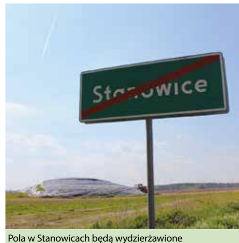
Pola w Stanowicach będą wydzierżawione

Zarówno uprawa miskanta jak i zagospodarowywanie osadów straciły dla nas sens. Zgodnie z nową strategią, Spółka ma skoncentrować się przede wszystkim na rozwoju obszaru zagospodarowania i przetwarzania odpadów.