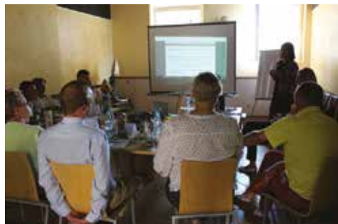
Kadra menedżerska podczas szkolenia z komunikacji...

Audyt zwrócił nam też uwagę na fakt, iż dział HR nie uporał się z problemem słabego przepływu informacji pomiędzy poszczególnymi szczeblami w firmie . Informacje, które wypływały z Zarządu nie docierały na najniższe